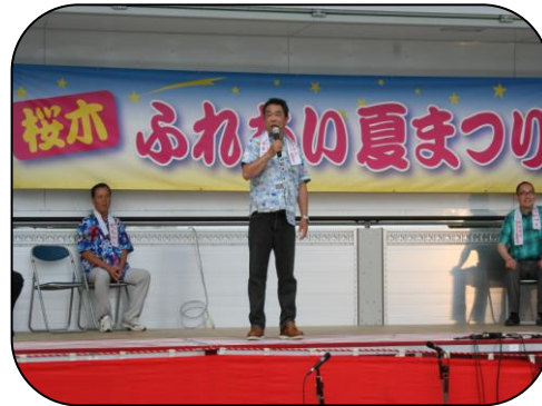
今年の実行委員長は「雨男」とのこと。でも、今日は好天。よかったね!