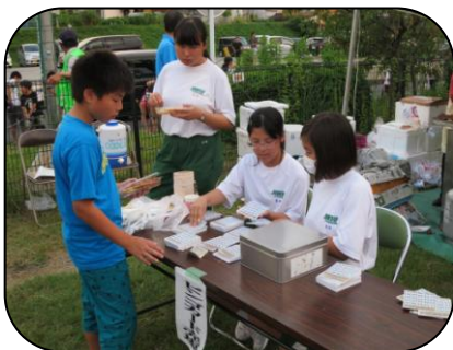
『ビンゴ カード下さい』 『当たりますように』