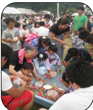
スーパーボール、ヨーヨー釣りなどの子どもコーナーは、終始元気な声がいっぱい!