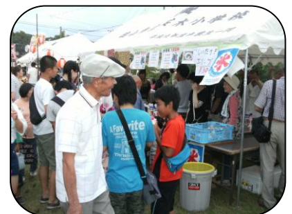
地域のバザー出店も大盛況! たくさんの人ばかりです!