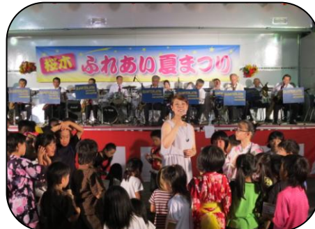
カルチュラタンの歌姫さん! きれいな声に子ども達も一緒に歌っています。