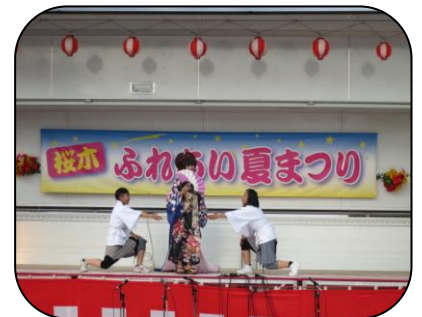
アソシエイツの迫力あるダンス! 新しいネタもいっぱいです。