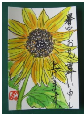
絵手紙を楽しむ会