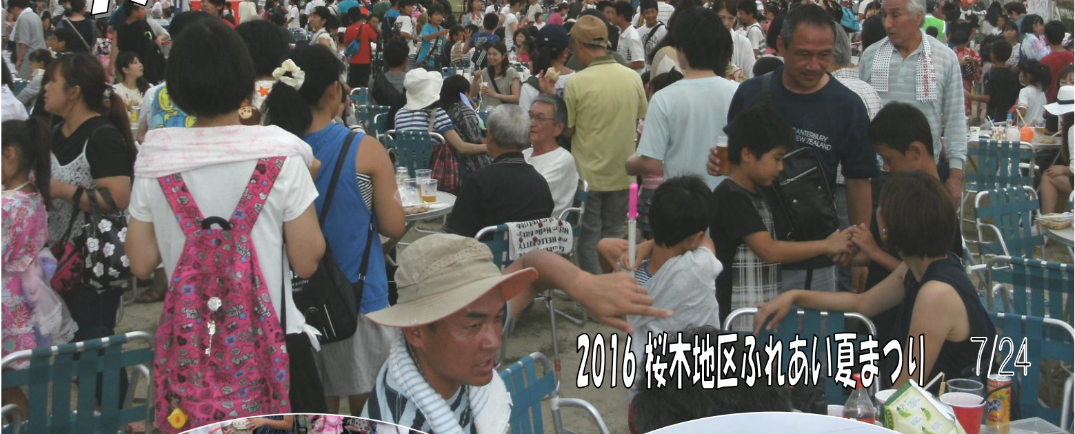
2016 桜木地区ふれあい夏まつり 7/24