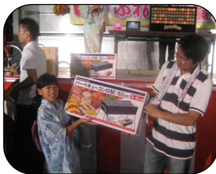
ビンゴゲームで豪華景品をゲット! 「来て良かったー!」