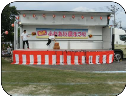
今年のニューフェイス! ヤングシティボーイズのパークールダンス