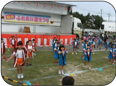
城ヶ丘保育園きりん組の『おまつり忍者』 ぞう組は『よさこい』 みんな元気いっぱいです!