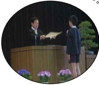
6年間の思い出胸に