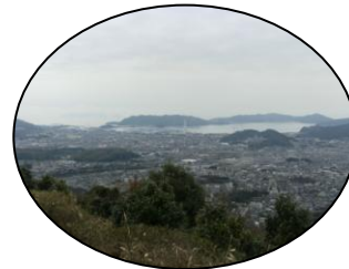
展望台から見る絶景!

地域の皆さんもぜひ、とおの山に登って、きれいになった展望台から絶景を楽しんでください。