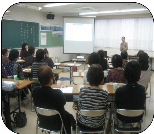
講師のユーマアにあふれるお話！ 皆さん、熱心に聞かれています。

用意されたたくさんのお話の中から、論文や小説では味わえない「愛」や「幸せ」があることに気付かせてくださいました。また、一冊の絵本は心を大きく動かしてくれるので価値が高い。より多くの大人が絵本に親しんでほしいと話されました。絵本の読み方を通して、人の生き方についてよき示唆を与えていただきました。