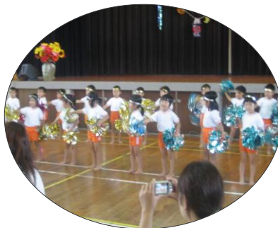
保育園児さん！ きらきらポンポンを持ってかわ いく元気におどります。