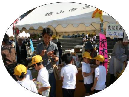
バザー出店! 今年は天気良すぎ 冷たいものが人気です。