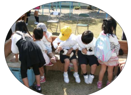
かわいい動物とのふれあい 笑顔もいっぱいです。