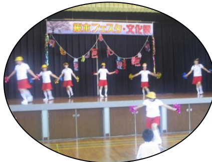
急きょ集まった地区ママさ んたちの即席ダンス。 かわい〜い! げんきい〜!