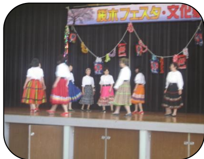
軽快な音楽で踊るフォークダ ンス。とてもリフレッシュし ています。