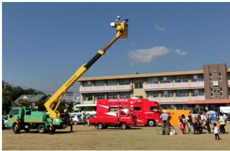
高所体験コーナー、煙体験コーナー 皆さん楽しんでいます。