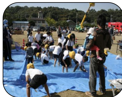
魚のつかみ取り ヤマメのすばしっこさに たじたじです。