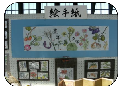
今年10周年を迎えた絵手紙 講座の作品。