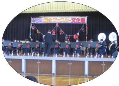
周陽中学校吹奏楽部の演奏。 知ってる曲に、 会場ノリノリ♪