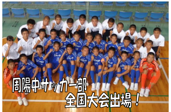
周陽中学校サッカー部 全国大会出場!