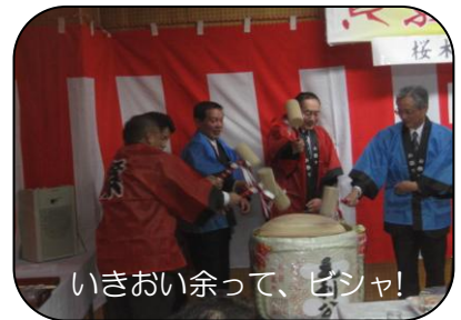
いきおい余って、ピシャ!