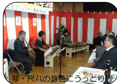
琴・尺八の音色にうっとり