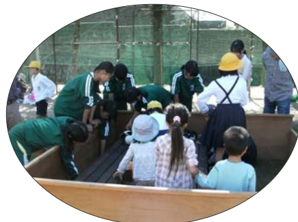
かわいい動物とのふれあい 笑顔もいっぱいです