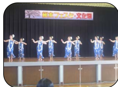
会場全体が ハワイの風でいっぱいです