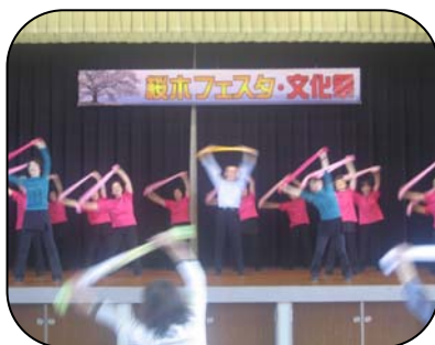
健康な心と体づくりに タオルを使って、頑張ります