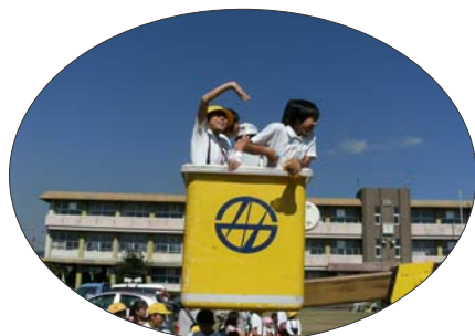
高所体験 何mまで上がるの、ソクソクだね!