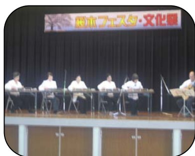
大正琴の美しい音色 会場の皆さんも、うっとり!