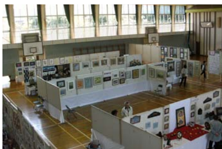
展示作品の鑑賞風景