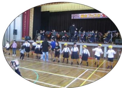
周陽中吹奏楽と 桜木小のようかい体操 中・小学のコラボが実現です