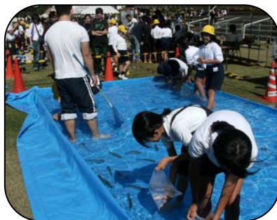
魚のつかみ取り ヤマメのすばしっこさに たじたじです