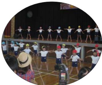
周南小さき花幼稚園児による 元気いっぱいの体操