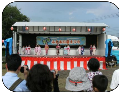
桜木子ども音楽教室による 「子ども達の歌」