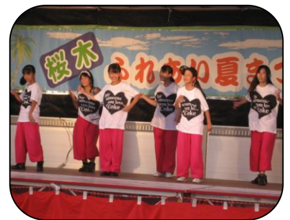
アソシエイツさんの スピード、迫力あるダンス!