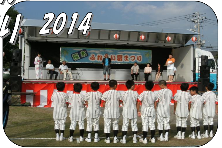
実行委員長の開会挨拶 “天候に恵まれ・・・”と挨拶の直後に雨が・・・ でも、直ぐに雨はあがり、ホッとしました。