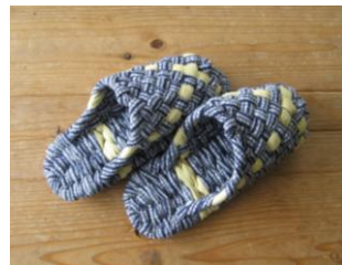
スリッパぞうり いもとさん