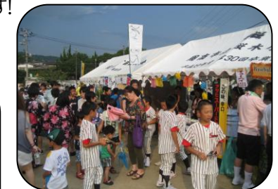
ビンゴゲームで自転車が大当 たり! 健康のためにも大いに 利用してください。