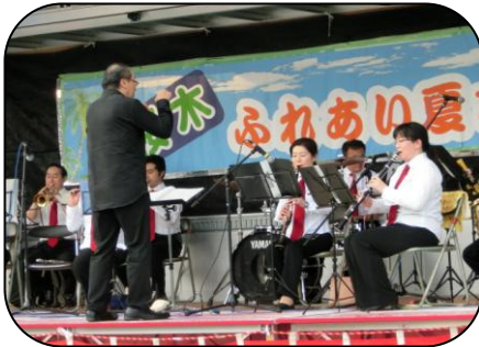
徳山吹奏楽団 アレンジされた曲が美しく、 迫力もあり!