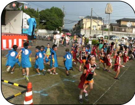
城ヶ丘保育園児のソーラン節 元気いっぱいです!!