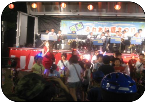
カルチェラタンの生演奏 AKB『恋するフォーチュンクッキー』の 曲に、大勢の子どもたちもダンス参加