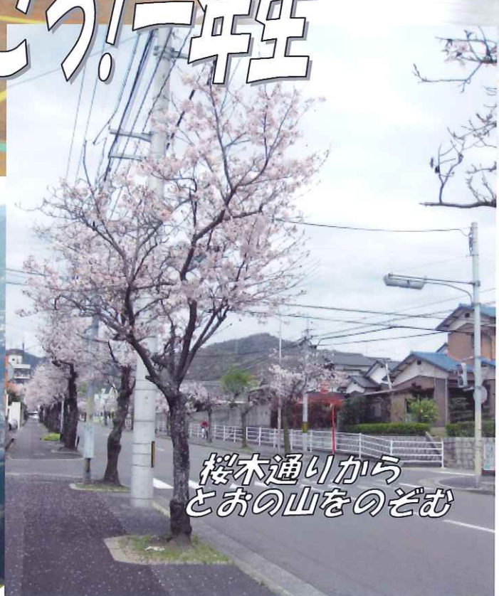
桜木通りから とあの山をのぞむ