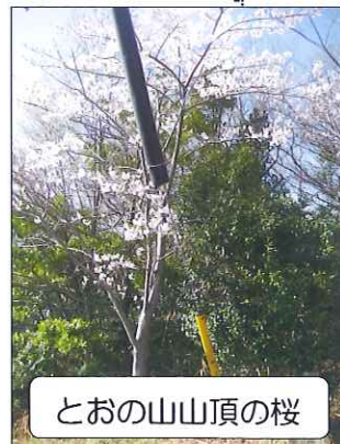
とおの山山頂の桜

徳山の桜は満開を過ぎて散り始めました。とおの山の山頂桜は5分～8分位？ 帰りに西緑地の徳山桜を観に寄ります。今年の春も速くに過ぎて夏が早そうです。又来ます。