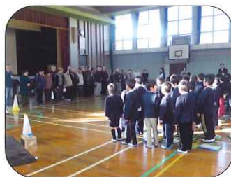
今日は、楽しく遊び・学びましょう

桜木小学校1年生の授業の協力を老連のみなさんがされました。かるた、あやとり、こま・・・寒い日でしたが、あちこちであったかい交流が行われました。