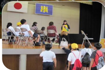
熱のこもった語りに、思わず 身をのりだした聞き手一同