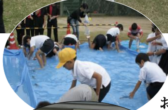
お魚君、さすがに 水の中では素早いな!