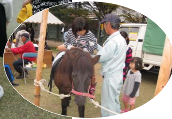
動物園の職員さん、 貴重な体験ありがとう!