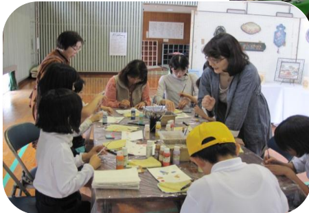
そうじゃなく、こうですよ “あ、そうか、そっか”