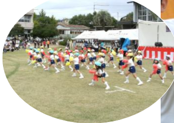
芝の緑、一段と きれいに見えるね!