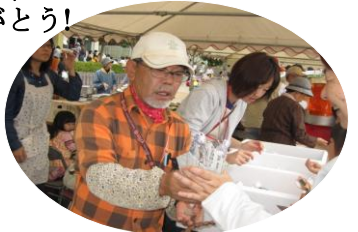
おいしい焼き芋いかがかな 地元の美味しい味だよ