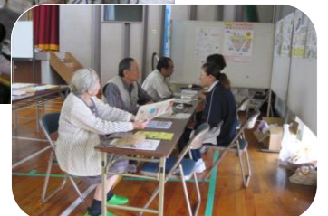
医師会・健康相談コーナー