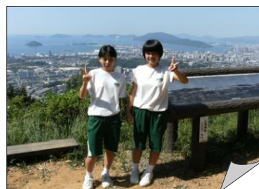
とおの山山頂でハイ、ポーズ!