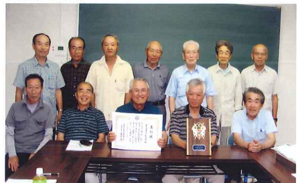
桜木支部の皆さん