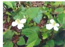
十薬・・・どくだみ草