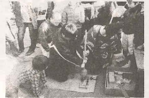
年男・年女による火おこし 火付