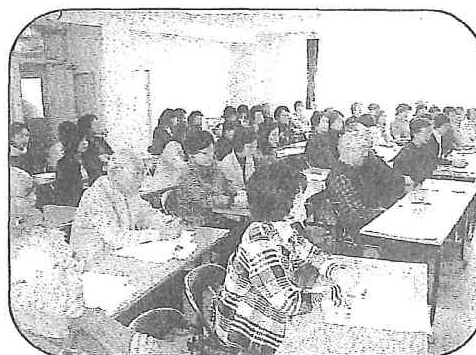
各講座・団体の代表者による 開講式風景

今年度は、講座・自主学習の数が併せて四十七団体、定期利用の地域団体が十団体となりました。講座等の数に変動はありませんが、内容は、体育・レク系のヨガ、健康体操、銭太鼓、自衛術等、心身の健康と安らぎを得ることを目的の講座が人気抜群です。芸術・教養系では、絵手紙を楽しむ会、ツールペイント、囲碁、料理教室等、益々たくさんに活動し今年度も入会がたくさんありました。ご希望の方は桜木公民館にお電話下さい。