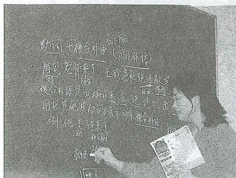
講座終了時には中国語が 黒板を埋めつくします

誰かが「シューシシューシ（休息休息ー終わりました）」と言ってクラスは終了。「ツアイチエン（再見ーさようなら、また会いましょう）」、シアシンチーチエン（下星期見ー来週会いましょう）」と言いながら帰途につきます。