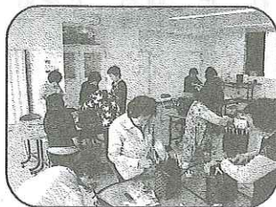
狭き門の講座です