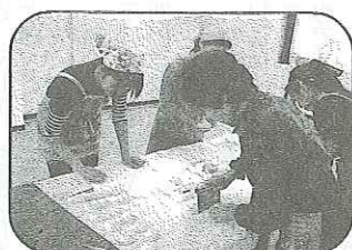
若い3人組先輩の技を盗む