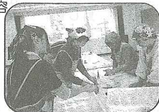
新しい仲間を求めて参加