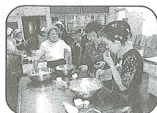
言葉では表せない「私の味」