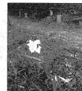
水仙の花が 登山道の15ヶ所に 植えられています