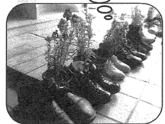
(4/6 午前 10:30 公民館玄関にて)

公民館では花壇で咲いた花を仲立ちにして 人と人との心をつないでいく運動をすすめています。