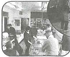
公民館大掃除 (12/11) 年間 20424 名の使用実績 (平成 18 年度) を誇り、埃も比例して多く大変でした。