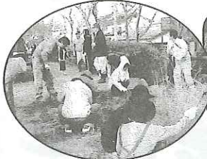
地区一斉クリーン作戦 (12/16) 全自治会 (11 地区) の約 1800 人が参加され、桜木地区内の環境と地区民の心が磨きあげられました。