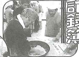
そば打ち教室 (12/12) 長野県産の新そばを入手の金峰そば塾直伝の技でねり上げた味は、そば通をうならす味でした。