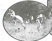
とおの山整備作業 (12/9) 雨で 1 日順延されましたが、45 名の方々の手で冬期登山道が整備されました。