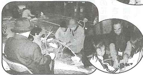
しめ縄作り教室 (12/15) 83 名の申込で大盛況でした。大人と子どもが 3 : 1 の割合で、市販の商品に見劣りしないのでばえでした。