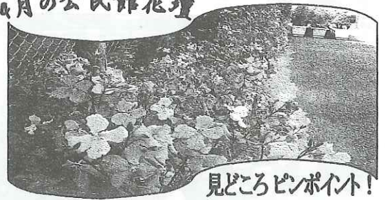
見どころポイント!