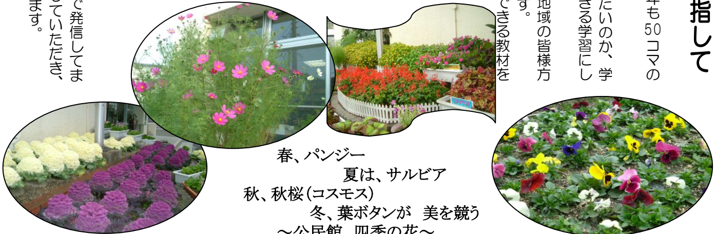
春、パンジー 夏は、サルビア 秋、秋桜(コスモス) 冬、葉ボタンが 美を競う ～公民館 四季の花～

公民館では、生涯学習への糸口となる情報を様々な手段で発信してまいります。そして、より多くの方々に学習の楽しさを実感していただき、桜木地区の人びとの「まちづくり」の一助とさせていただきます。