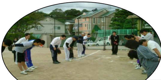
地区ソフトボール大会 (10/23)