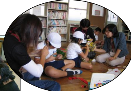
桜木小ミニどんぐりの会