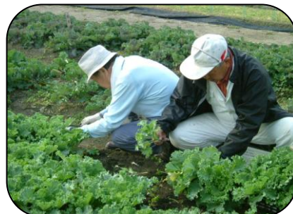
葉ポタンの出荷 [老連育苗会] (10/26)