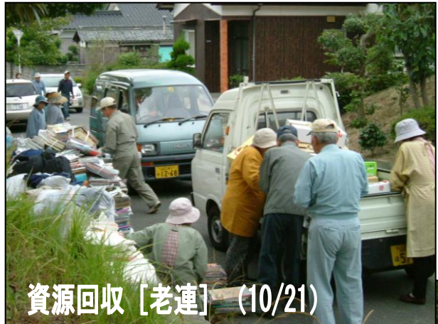
資源回収 [老連] (10/21)