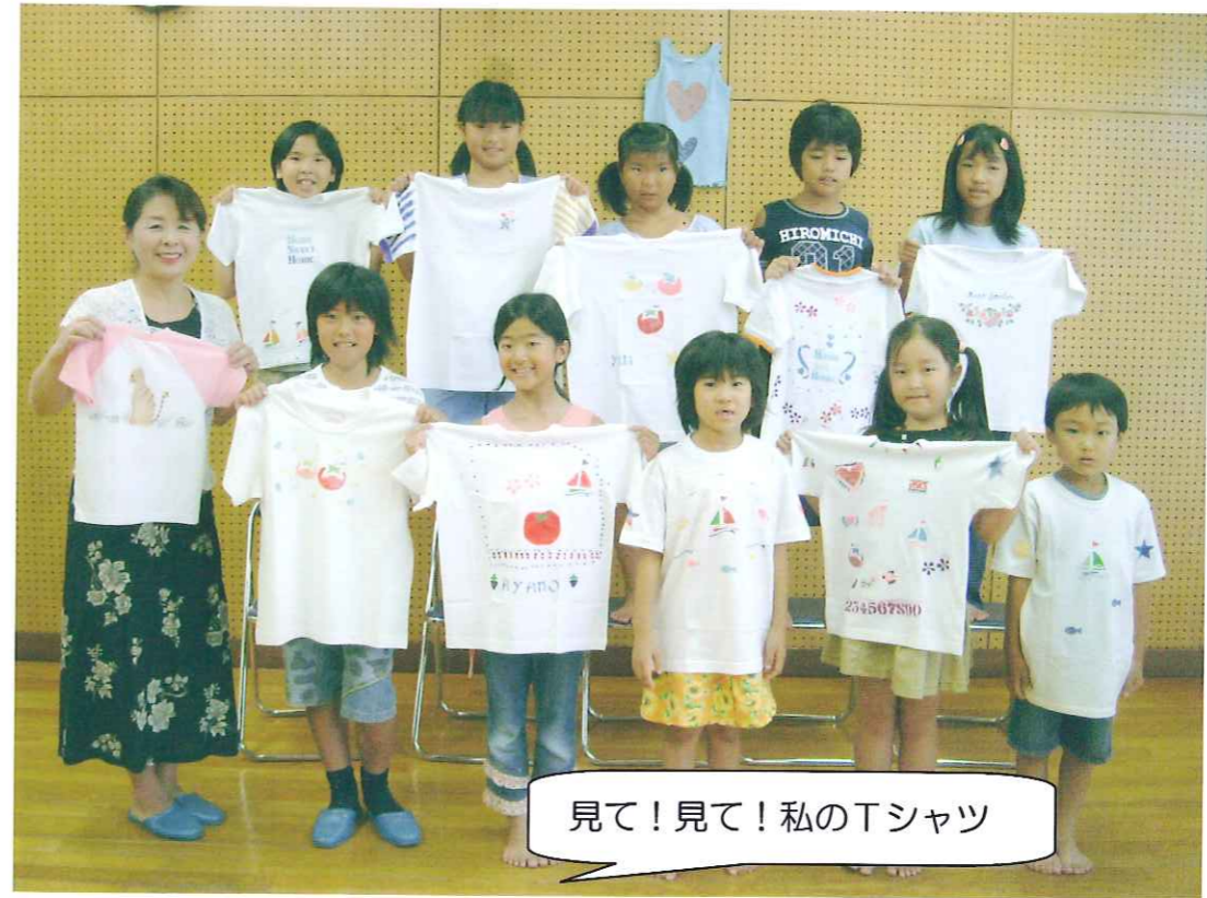
見て!見て!私のTシャツ