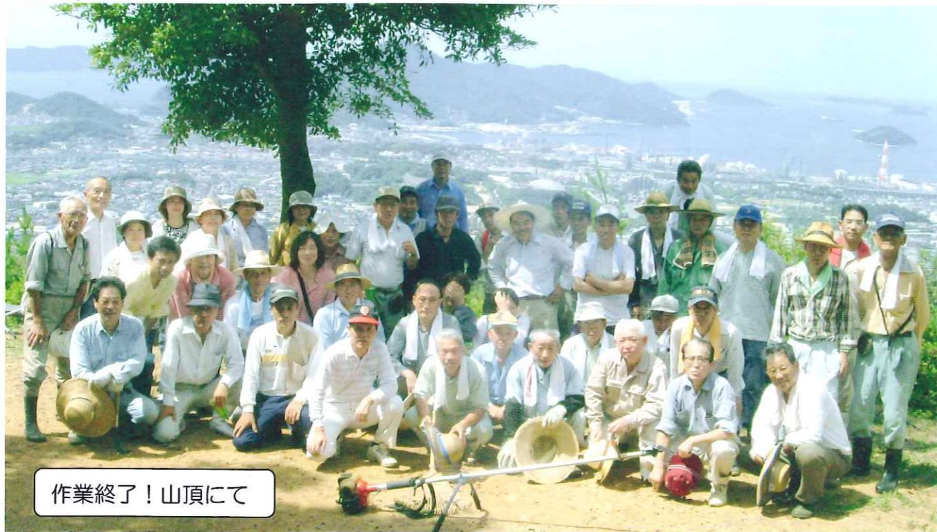
作業終了！山頂にて

周南市城ヶ丘2-4-21 TEL 0834 (28) 5973 FAX 0834 (29) 0788 sakura-ko@city.shunan.yamaguchi.jp