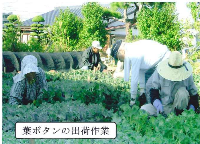
葉ボタンの出荷作業