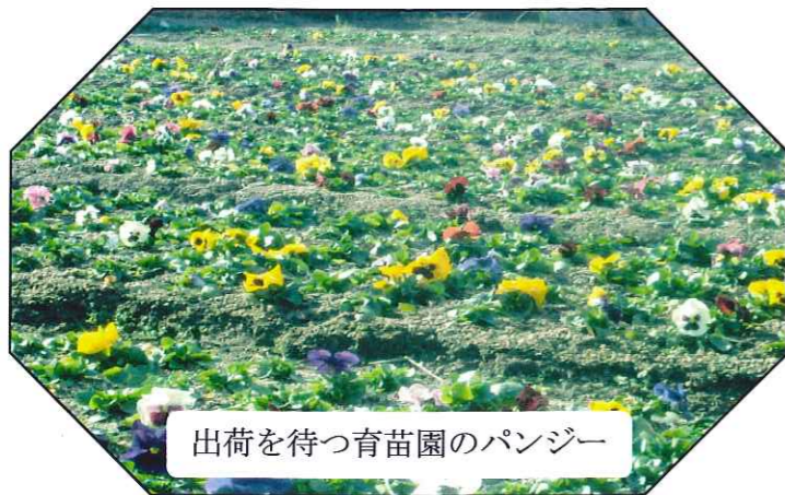
出荷を待つ育苗園のパンジー

「一汗かいたな」と、資源回収や苗の出荷作業に追われた方々。 「冷や汗をかきましたよ」と、桜木小学校の昔体験学習に参加された人たち。 老連の2月は、引っぱりだこで大忙しの月でした。 ところで、汗の正体はなんでしょう。 汗は、99%が水であり、残り僅かな塩化ナトリウムやアンモニア・尿素などからできています。同じような成分からできているものに涙があります。 最近の生活の中で汗や涙から疎遠になってきているのが心配です。乾いた人の心に水分をたっぷり含んだ汗や涙を注ぎ込み、心に潤いを取り戻したいものです。特に、身近な人の汗や涙は、心の奥底にまでしみ込んでいく貴重な子育ての教材と言えますよ。 老連の汗の一滴が、ピカリと光ります。