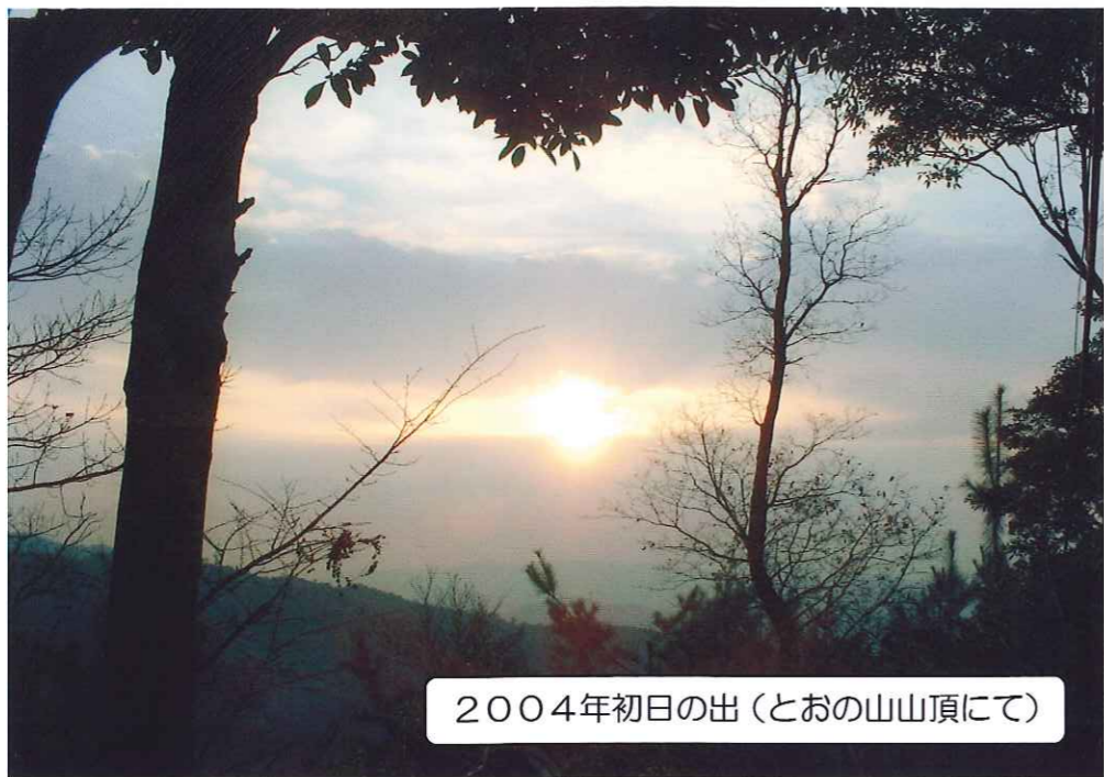
2004年初日の出(とおの山山頂にて)