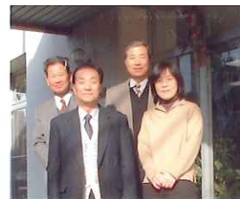
本年もよろしく お願いいたします 桜木公民館職員一同