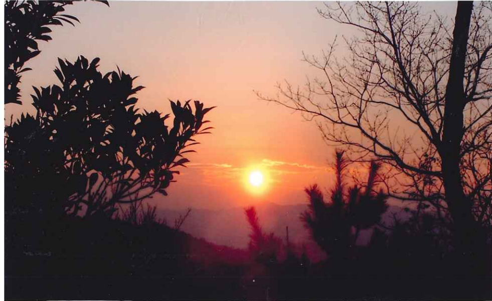
2003年の初日の出 (とおの山山頂より東の空を望む)

平成15年 1月号 No. 179 桜木公民館 徳山市城ヶ丘2-4-21 TEL 0834 (28) 5973 FAX 0834 (29) 0788 sakura-ko@city.tokuyama.yamaguchi.jp