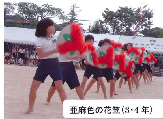
亜麻色の花笠(3・4年)