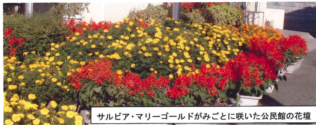
サルビア・マリーゴールドがみごとに咲いた公民館の花壇