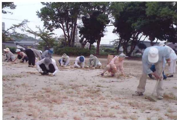
9月20日(金)社会奉仕の日に、桜木老連のみなさんは地域の公園の清掃をされ、とてもきれいになりました。

『ふれあおう、みつけよう、輝こう』がテーマです。みて発見し、参加して、感動の1日とされては・・・。