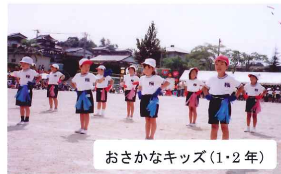
おさかなキッズ(1・2年)

暑さ厳しい9月7日(土)午前8時より城ヶ丘公園で、老連と子ども会150名のみなさんで三世代交流スポーツ大会が行なわれました。各子ども会から参加された皆さんは、老連の方の指導を受け、ベタンク・グラウンドゴルフを汗びっしょりになりながら楽しみました。やってみるとおもしろくて、子どもより大人のほうが一生懸命になりました。老連の方は、暑い中ずっと審判をして下さっていて、とてもお元気ですね。などの声がありました。楽しいふれあいのひとときでした。