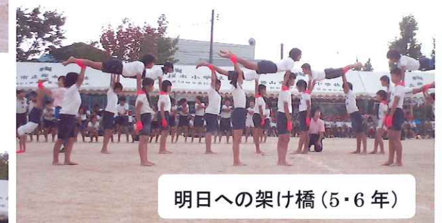
明日への架け橋(5・6年)

1年生のかわいらしさ・6年生のたくましさ、みんな一生懸命でみんなかっこよかったよ!