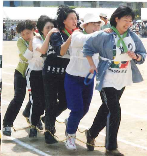
(平成12年つなひき・むかで競争に熱く燃える皆さん)