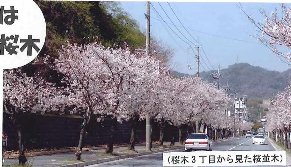
(桜木3丁目から見た桜並木)