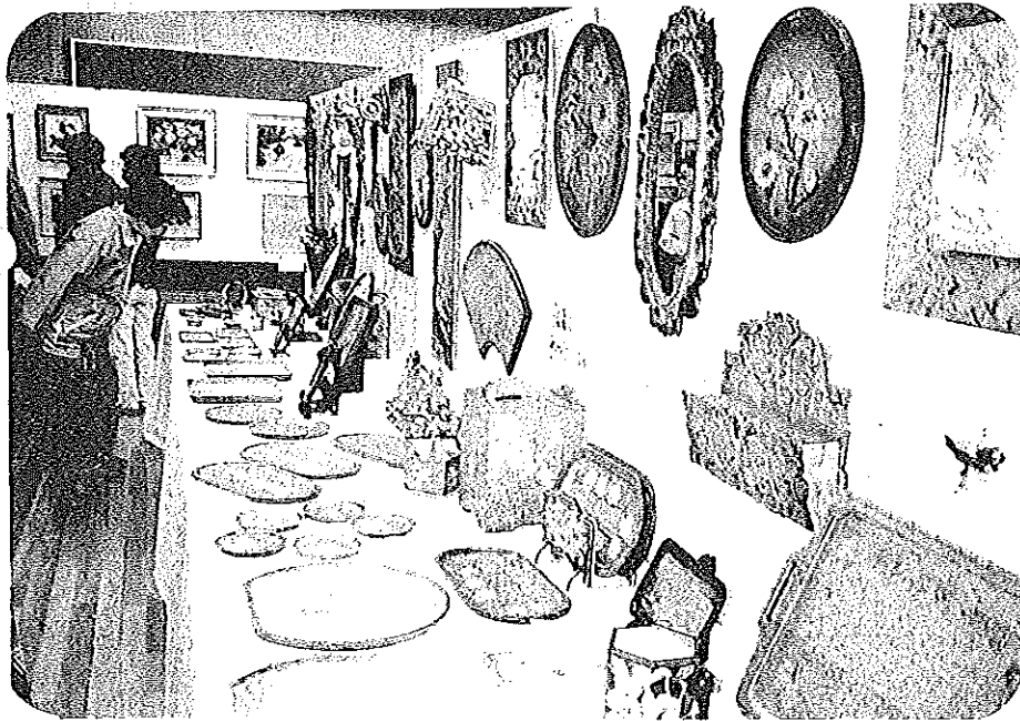
わあ!! すていね (木彫)