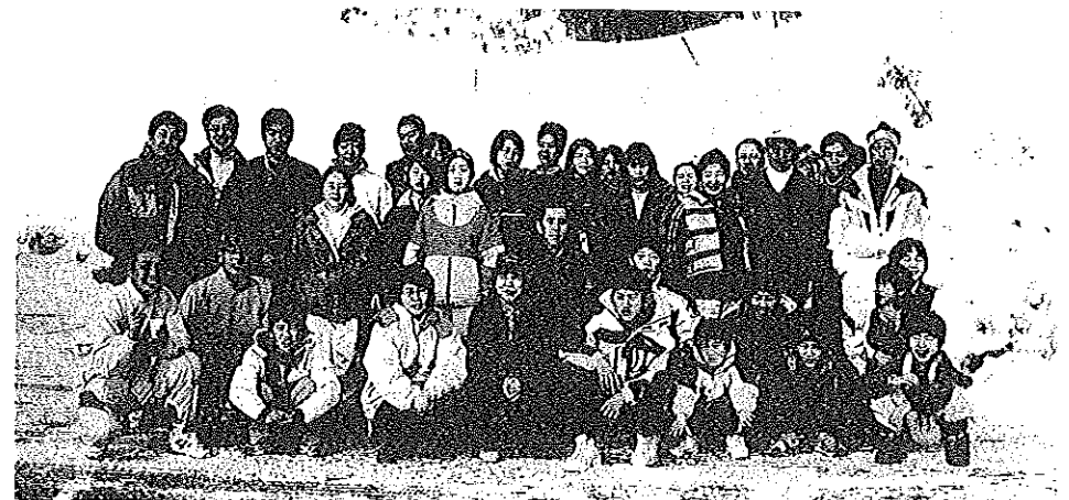
(スキー場をバックにスキーを楽しんだ参加者の皆さん)

今さらスキーなんて、私の生活とは無縁と思っていたのに、機会があって、生まれて始めてチャレンジしました。 スキー板をはき、ストックでトンと雪をけつてすうっと白銀を滑り降りると、イメージを思い描いていたのに、現実には満足に立てもせず、尻餅ばかり。これは無理だなあと内心諦めかけたけれど、「足を八の字に開き、体重を前にかけて、前方を見ながら滑って」と熱心な指導のお蔭でいつの間にかなんとか雪の上を滑っている自分に気づいた時のうれしさ。一度も転ばず下まで滑り降りれた時のうれしさは格別で、思った以上の楽しさに、はまってしまいました。 またチャンスがあれば今度はもっと格好よく滑ってみせるぞと思っている私です。