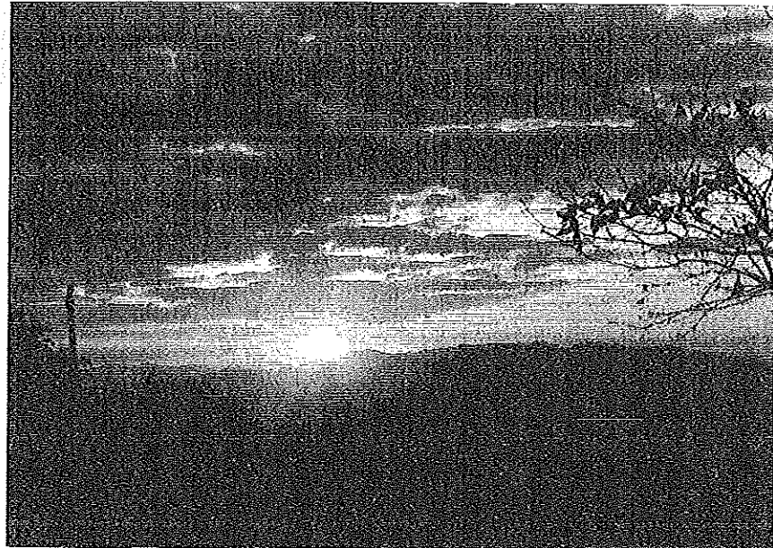
雲海を紅く染めて昇る、初日の出（とおの山より）

平成11年 1月号 No.131 桜木公民館 徳山市城ヶ丘2-4-21 TEL. 0834(28)5973 FAX. 0834(29)0788