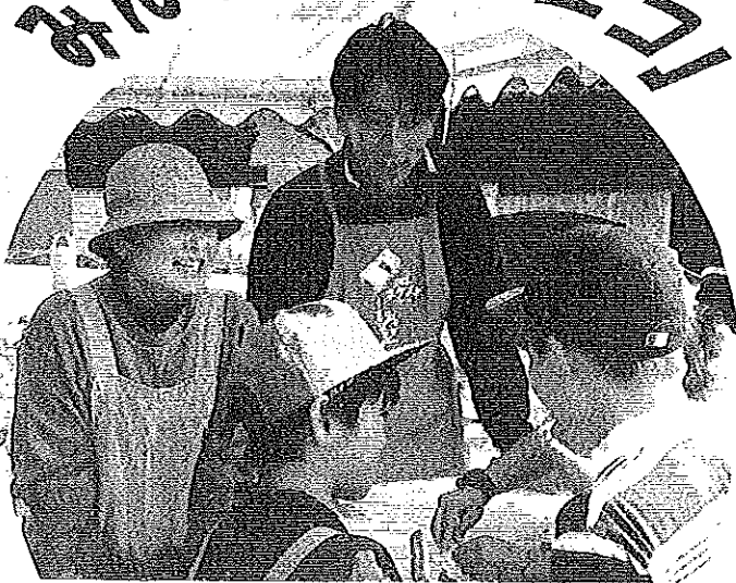
桜木小の先生 バザーで大活躍