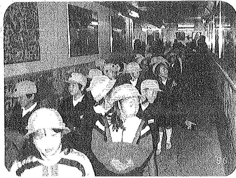
11月21日(土)開通式の後、渡り初め

この地下道は、国道で二分されている城ヶ丘、平原地域と桜木地域を結ぶ、桜木地区唯一の生活幹線道であり、利用者が多いことから、何時も汚れがちの道でありました。 この度「清掃の先取り、汚れない環境作り」を基