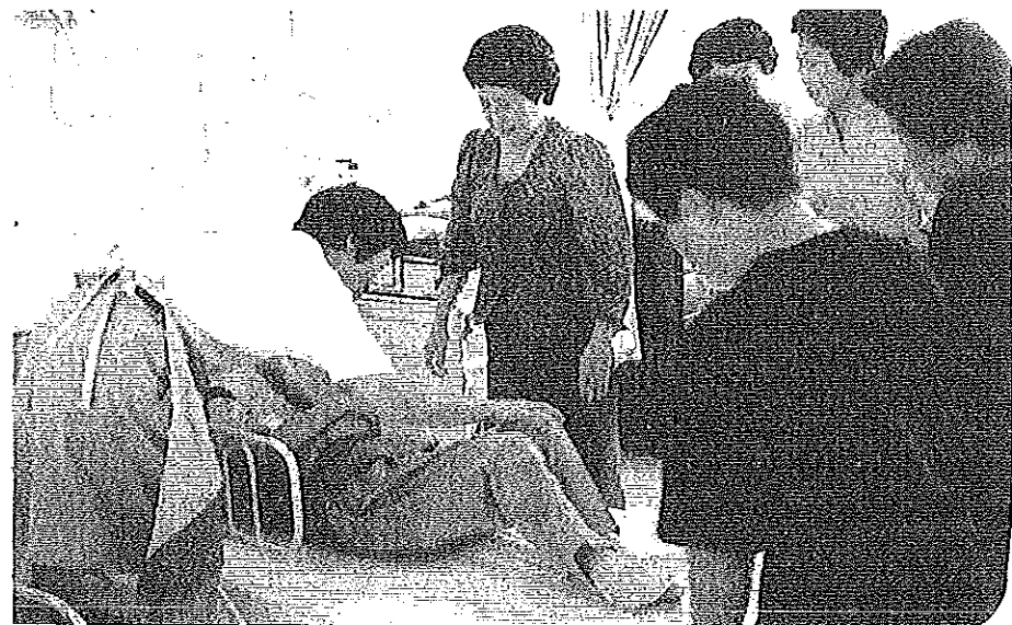
(写真上 車イスでの階段の登り降りは大変) (写真右 寝たきりの人のシーツ交換実習)

になるのでしょうか。自分の住んでいる隣近所はどこも高齢者の方々がばかりということになっていくわけですか。いつ誰が寝たきりの生活を余儀なくされるかわかりませんが、これからは、老人養護施設に入所できるということはできず、何年も待たなければならなくなると思われます。 桜木公民館では、5年前から「在宅老人お世話教室」を開いています。受講者が年々少なくなっているのが気になるところですが、受講者はみんな意欲的に実習に取り組み、来年度も続けて開きたいと思っておりますので、たくさんの方々の受講をお待ちしています。