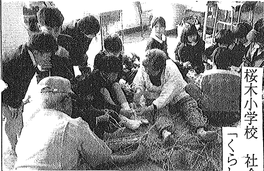
桜木小学校 社会科学習

平成8年 3月号 桜木公民館 徳山市城ヶ丘2-4-21 TEL.(0834)-28-5973 FAX.29-0788