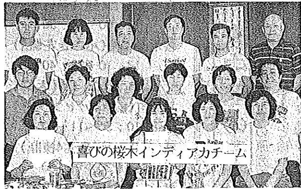
喜びの桜木インディアカチーム

第11回徳山市インディアカの集いで、決勝トーナメントに駒を進めた桜木の2チームが、2位3位を独占するという栄冠に輝きました。 ※桜木小学校体育館での「楽しいインディアカ練習日」で(毎週水、土曜日 夜8時～10時)いっしょに汗を流しませんか。お待ちしております。