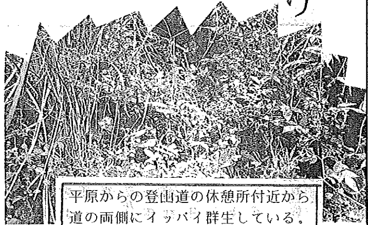
平原からの登山道の休憩所付近から道の両側にイヌバヤ群生している。 【写真は5/26の状況】