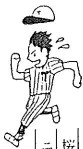
桜木体振ニュース

〔第三十一回〕桜木地区ソフトボール大会 五月十六日に開催された地区十一自治会区分チームの参加による熱戦の結果、表示のような入賞成績でした。