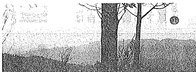
①、② とおの山東方に昇った初日の出