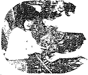
農園での楽しいいも掘り

十月二十七日に桜木小学校なかよしクラブと老人クラブが、仲良し農園で「いも掘り」を行い、公民館で穫れたばかりの芋で「さつまいも汁」を作り、昼食を共にして楽しい収穫祭りを過ごしました。 今年も収穫量も多く全部で約200キロぐらいいりました。