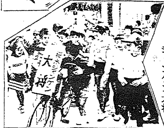
(右)福引抽選コーナー (左)賞品(巨額)獲得したジャンケン大将

【秋本番】燃えるフェスティバル ブレッシュニ桜木7000祭 夏まつりに代わる桜木地区恒々の秋の大イベント(第四回)は、前回を上回る盛会であった。 市内各方面で色々な催しがあったにも拘わらず、地区内外から多勢の観客の来場があり、特別ゲスト(笑福亭こっちゃん、アミヤト、甲斐美)の珍妙爆笑の司会進行と、歌謡ゲスト(小川めぐみ)の演歌につれられて、ふれあいの輪が大きく広がって大成功であった。 (左)ふれあい繁盛(たたみ半畳に何人乗れるか?)