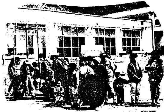
ウォークラリーの表彰式

3月13・14日に、大津島の明日を考える会のメンバーが、子供の大勢いる島のことを研修に行きました。