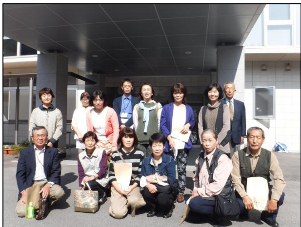
写真上:特別養護老人ホーム「あかり園」の玄関口にて

10月23日（金）、福祉部参加者12名で、防府市にある特別養護老人ホーム「あかり園」を訪れました。まず、園長さんと研修担当者の方から、施設の概要や施設内の管理体制など説明を受けました。その後、2つのグループに分かれて施設の中を見学しました。視察終了後昼食をとり、午後から今話題の「花燃ゆ大河ドラマ館」、国指定史跡「英雲荘」を巡り、郷土の歴史について学びました。天候にも恵まれ、道中バスの中では委員同士の友好も深まり、充実した研修会となりました。