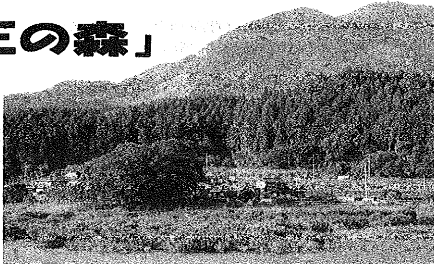
写真中央 「天王の森」

皆さんは、「天王の森」をご存知ですか？「天王の森」は、五味自治会館の隣（向道ダム東側岸辺）にあります。ここの地名「天王」にあることからそう云われ、通称「森さま」と呼ばれています。平成2年には「徳山百樹」に選ばれました。大きな石の上に祠があり、それを覆うようにケヤキやエノキがこんもりと茂り、小さな森をつくっています。この巨樹を、ダムを隔てた国道315号線から眺めると、金峰山を背にちょうど大向の中心に鎮座し、大向地区を見守ってくれているかのようです。（参照本：徳山百樹）