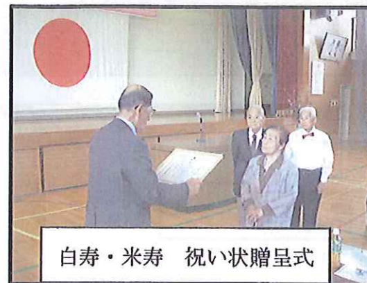
白寿・米寿 祝い状贈呈式