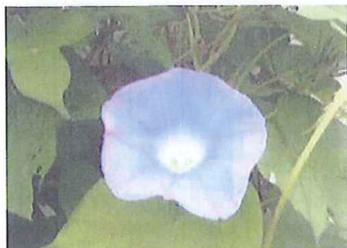
翔北中学校で咲いたアサガオ

今年は、地域の皆さんと一緒にこのアサガオを育てたいと思います。種をご希望の方がいましたら、公民館までお越し下さい。