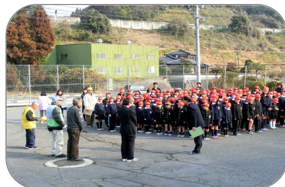
昨年の避難訓練の様子

地域の皆様におかれましても、大河内小の取り組みに、ご理解ご協力いただきますよう、お願いいたします。