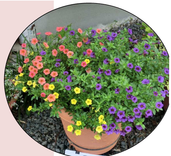
一昨年の優秀作品