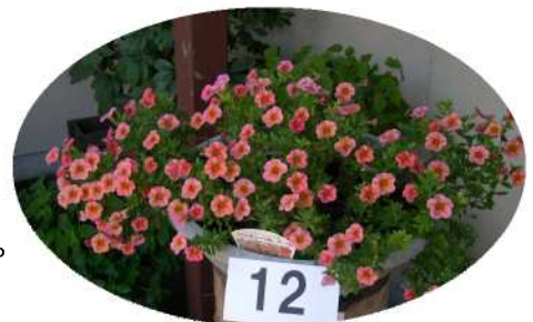
一昨年の優秀作品