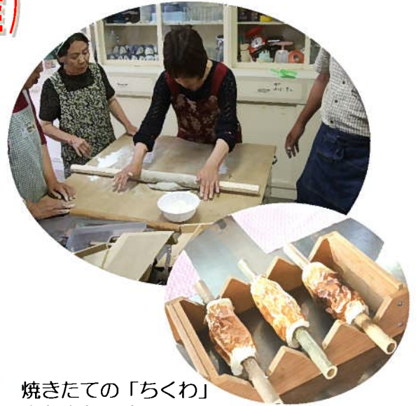
焼きたての「ちくわ」 ホクホクです。