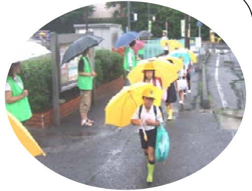
公民館前の様子です