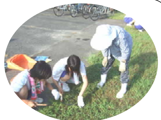
鎌の使い方を教わる子供達

大河内小学校は芸術部、大河内公民館は吹奏楽部、大河内駅は柔道部が担当しました。普段なかなか手の行き届かないところまで大変きれいにしてもらい、ありがとうございました。