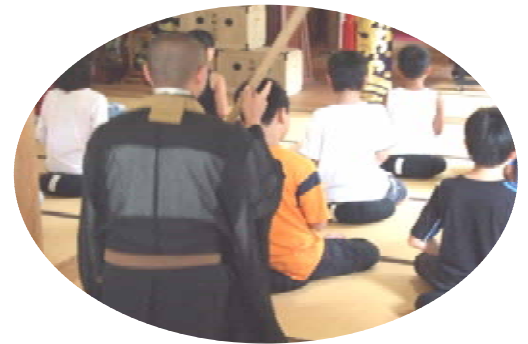
本堂の中には警策の音が

カレー作りやスイカ割りなどの野外活動に加え、珍しい座禅体験も実施。子ども達は、日頃慣れない座禅に苦勞しながらも、精神を集中させていました。