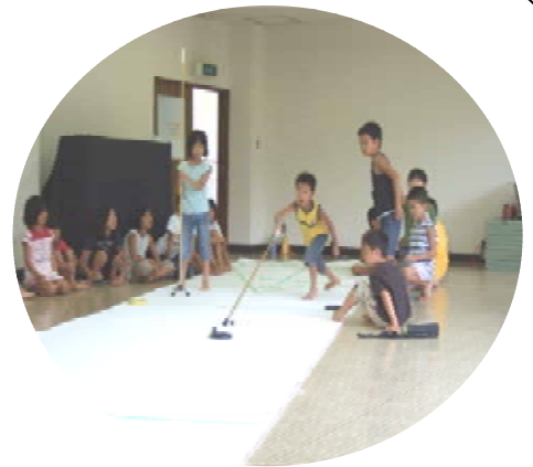
キューを使い円盤を押し出します。うまく止まるかな?