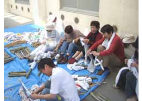
夏まつり当日。松明を100本近く作ります。地域の方々の協力なしでは出来ない行事です。