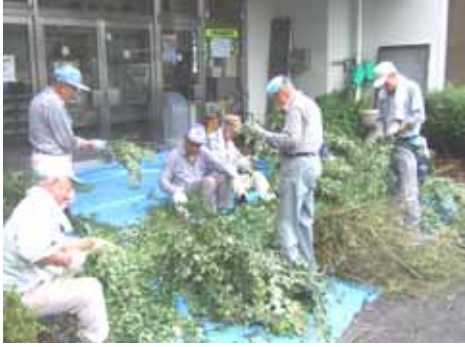
7 / 3、柱松の第一歩。ハギの枝を刈り取り、葉をむしり取ります。葉は全て天日で乾燥させておきます。