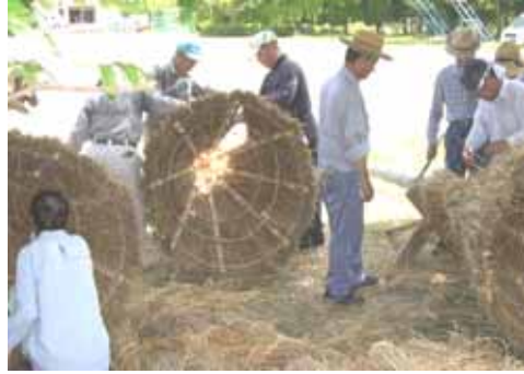
7 / 25、竹を切り出し、麦わらで傘を作り。傘にはハギの葉や花火を詰め込みます。