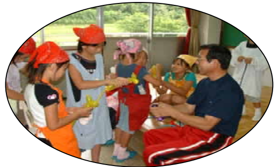
7月の食生活改善推進協議会の方による 子ども料理教室と同日開催 ふれあい教室（風船アート）の様子