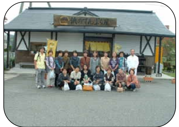
10月の西海食品(株) <山陽小野田市> 施設見学