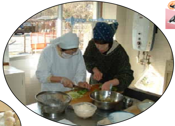
2月の料理教室の様子