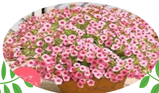
ミリオンベル ブーケ