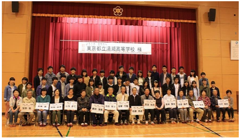
周南学びの旅 入村式での清瀬高校の生徒さんと民泊受け入れ家庭の皆さんでの一枚です

「観光スタイルから「見る観光」から「体験滞在型観光」に変化し、中高生の修学旅行も体験型への関心が高まる中で、民家でホームステイ「民泊」をしながら、田舎体験・生活体験を行い、住民との交流を深める「体験型教育旅行」を行う学校も多くなっています。