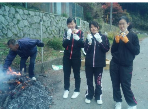
東中学校の生徒さん。掃除して集めた落ち葉で焼き芋を焼いて皆で食べました！

岩国市の東中の生徒さんが来られたときには、近所の三嶋神社近くの落ち葉を集める掃除をしてもらいました。集めた落ち葉で焼き芋をして、皆で食べました。落ち葉で焼き芋を焼く体験は初めてで、「楽しかった」と喜んでくれました。