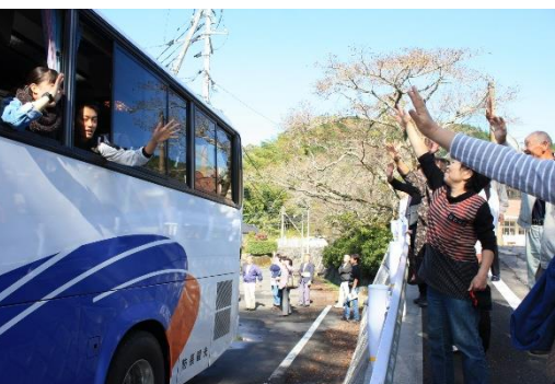
バスに乗っていよいよ出発です

「私たちは、周南市の中山間地域の豊かな自然、美しい景観、歴史・文化、食や生業、暮らし、技などの地域資源を活かした、自然体験や農林水産業の体験、民泊等による生活体験など、都市と農山漁村の「交流」を通して、地域の活力や経済循環の創出を図るため、地域団体等が連携して、推進の基盤となる地域協議会をここに設立し、下記の事項に取り組んでいます。そして、地域協議会の構成団体や地域の住民が一体となつて、自信と誇りを持って暮らせる中山間地域の実現と訪れる人々に心からの感動と喜びを与えられる体験の提供に向けて、様々な取り組みを進めてまいります。」