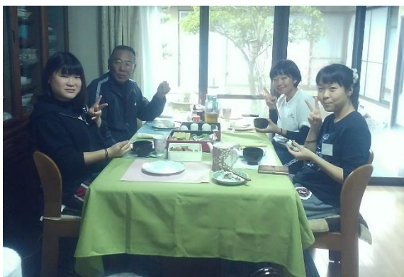
森田さん宅での清瀬高校生徒さん食卓風景

『この度、民泊で来られた清瀬高校の生徒さんは、「スカートの中のホックが留まらない」というくらいご飯をよく食べてくれたのでうれしかったです。初日の大道理地区合同での食事会での猪肉、大道理産野菜のバーベキューでも、「美味しかった」