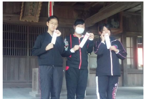
神社掃除の後、おみくじを引きました！