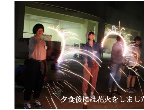
夕食後には花火をしました！