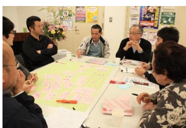
連携することで幅広く豊かなアイデアが生まれます!