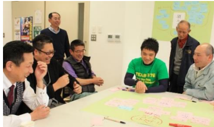
話し合いの風景です。楽しい意見が出る度に皆さん思わず笑顔が...