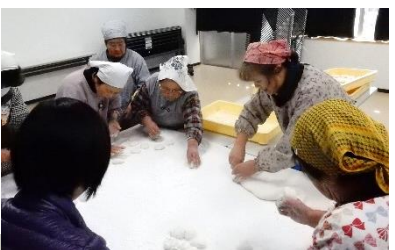
昼食の準備風景です。上の写真は朝搦いたお餅を丸めておられる様子です。餅豚汁・酢の物等の手作りの昼食で参加者の方をおもてなしします！