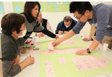
次々と意見を出し合っておられます