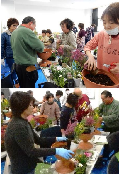
春らしい彩の美しい寄せ植えです！