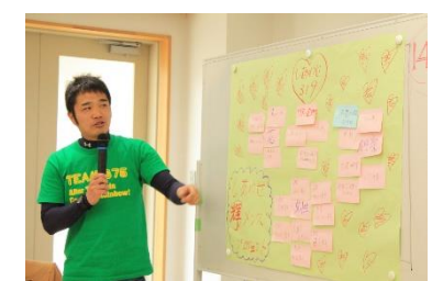
発表されています!