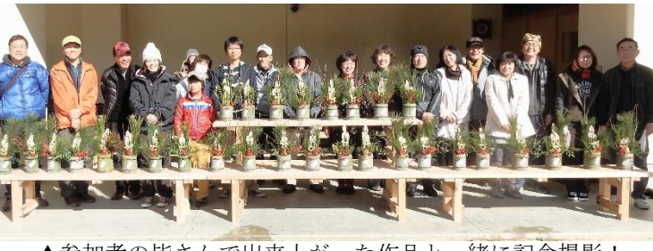
▲参加者の皆さんで出来上がった作品と一緒に記念撮影！