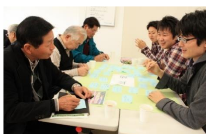
長穂地区の皆さんの自慢発表前の話し合い風景です