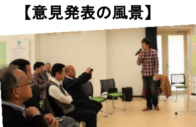
皆さん熱心に聞いておられます