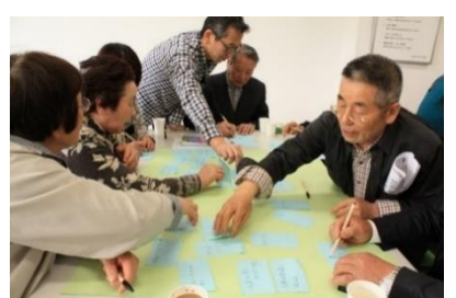
鹿野地区の方が地域の自慢を挙げておられます