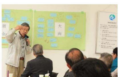
大向地区の方が自慢発表されています